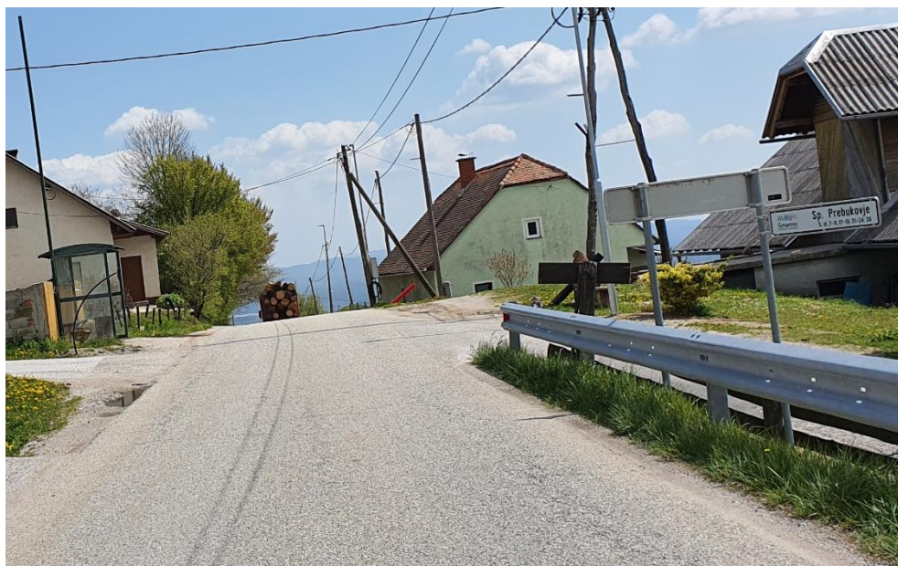
Slika 9 : Urejeno avtobusno postajališče v smeri Slovenska Bistrica – Šmartno na Pohorju, neurejeno postajališče v smeri Šmartno na Pohorju – Slovenska Bistrica ter brez ustreznih oznak in prehoda za pešce