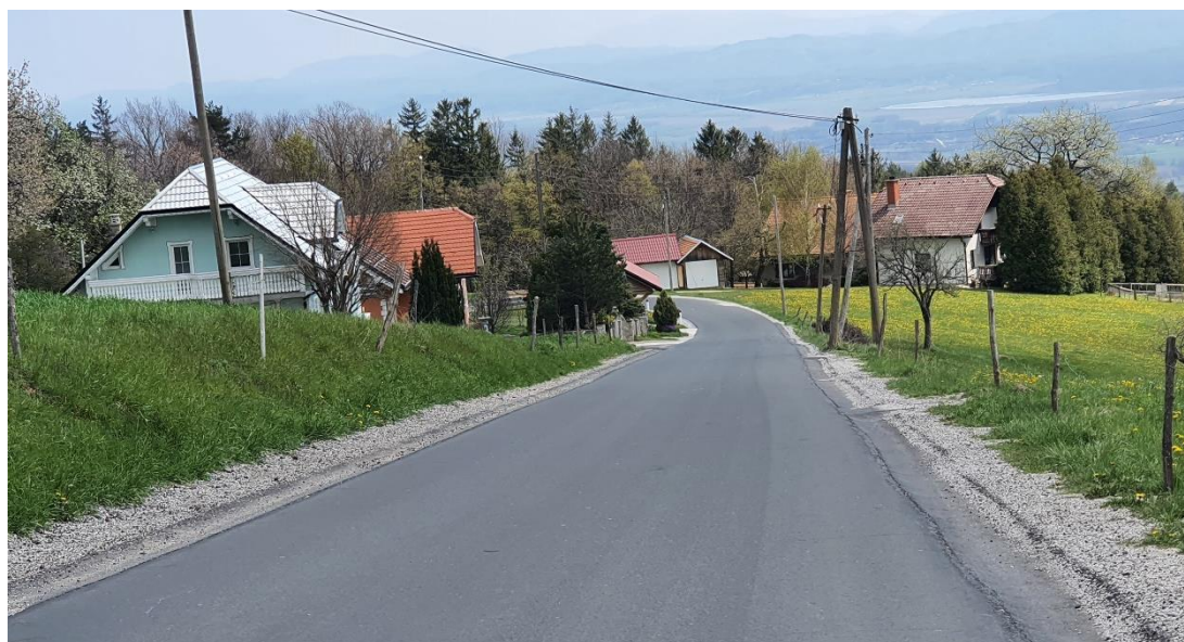
Slika 7: Zgornje Prebukovje – cestišče brez pločnika