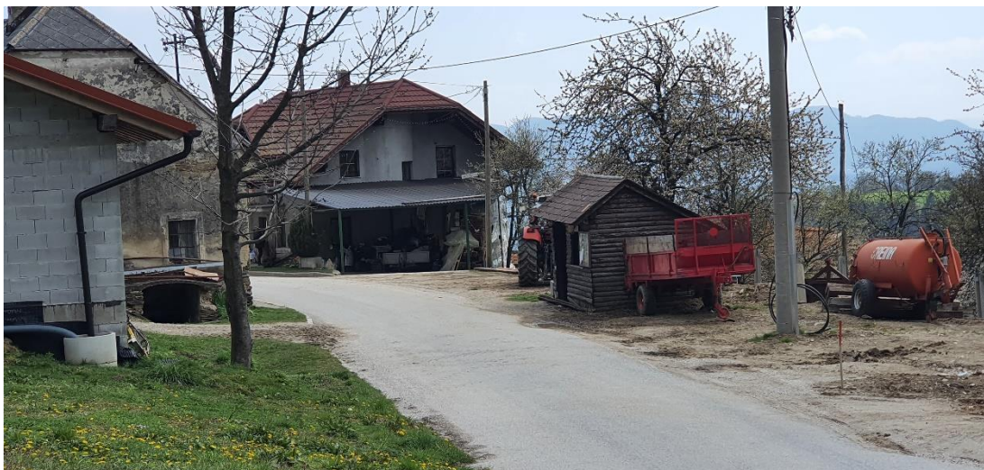
Slika 6: Neurejeno avtobusno postajališče v Zgornjem Prebukovju v smeri Slovenska Bistrica – Šmartno na Pohorju in obratno, brez ustreznih oznak in prehoda za pešce