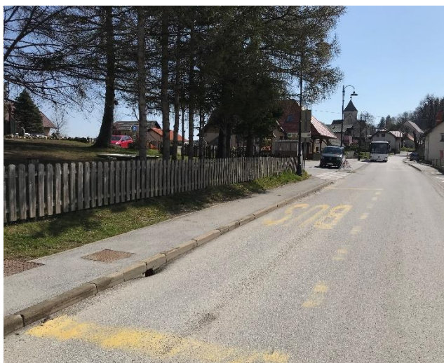
Slika 2: Urejen pločnik in postajališče organiziranega šolskega prevoza (kombi) ter avtobusno postajališče ob šoli