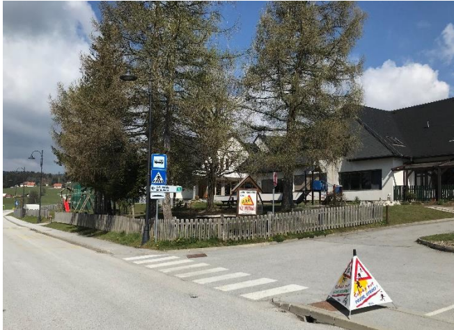
Slika 3: Urejen prehod za pešce iz smeri postajališča organiziranega šolskega prevoza in avtobusnega postajališča do šole

Učenci iz vasi Spodnje in Zgornje Prebukovje, ki uporabljajo za prihod in odhod v šolo organiziran šolski prevoz v smeri Slovenska Bistrica – Šmartno na Pohorju do avtobusnih postajališč hodijo ob robu cestišča kjer ni urejenih pločnikov (Priloga 1).