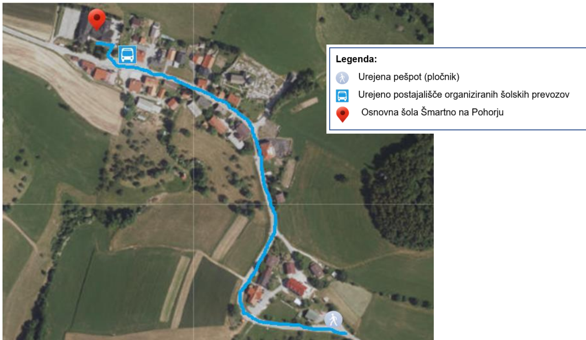
Slika 4: Načrt pešpoti za otroke iz strnjenegega naselja Šmartno na Pohorju