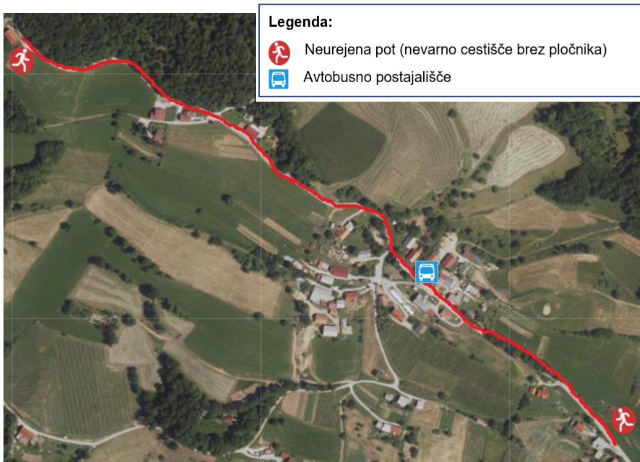
Slika 8: Spodnje Prebukovje