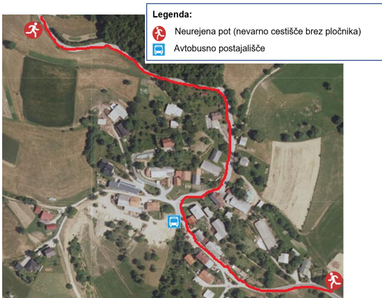
Slika 5: Zgornje Prebukovje