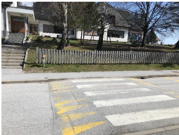
Slika 1: Urejen prehod za pešce pred vhodom v šolo

Šola ima izdelan načrt varne šolske poti za učence iz območja vasi Šmartno na Pohorju, ki prihajajo v šolo peš. Ti učenci za prihod in odhod koristijo urejen pločnik, ki vodijo v smer Slovenska Bistrica – Šmartno na Pohorju.